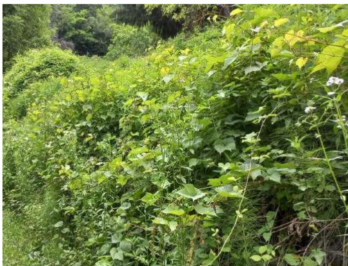
FOTO 4 - Cespugliosa