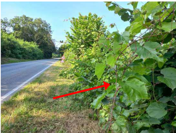
PARTICOLARE DI FOGLIE VITE UTILE AL RICONOSCIMENTO