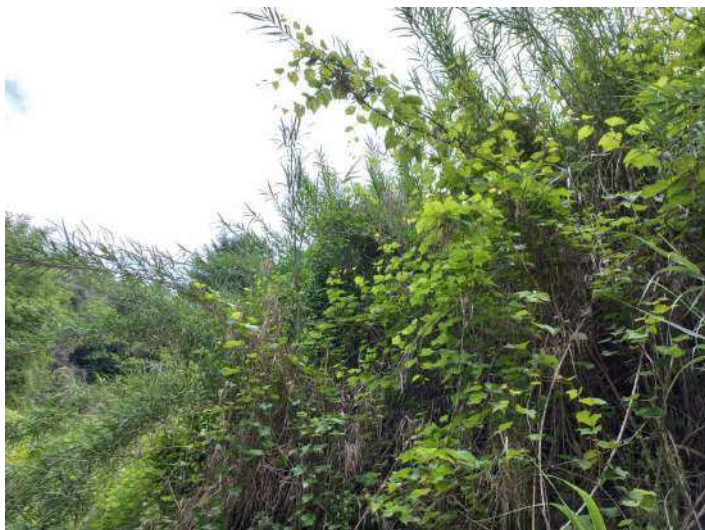
FOTO 5 - Rampicante