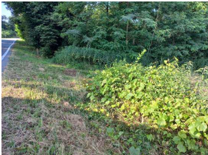
FOTO 3 - Strisciante